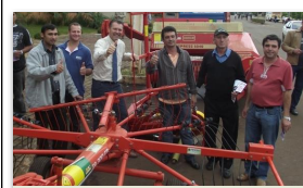
Entrega de máquinas

No primeiro semestre de 2011, Hamm retornou há mais de 80 municípios.